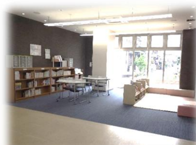
1階エントランス図書コーナー